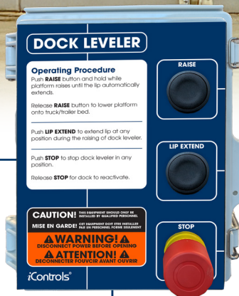
Panel para nivelador de muelle de tres botones